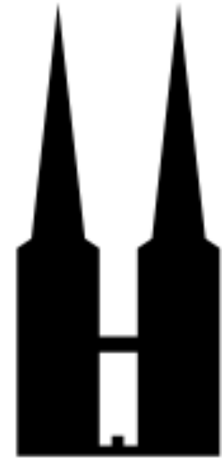
Dom zu Lübeck