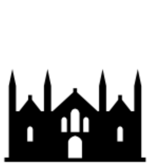
Heiligen Geist Hospital